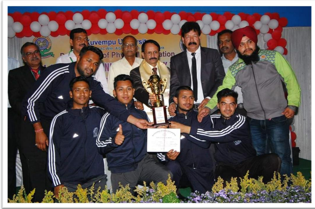
College team bagged 2nd position at AIU Wushu (Taolu)